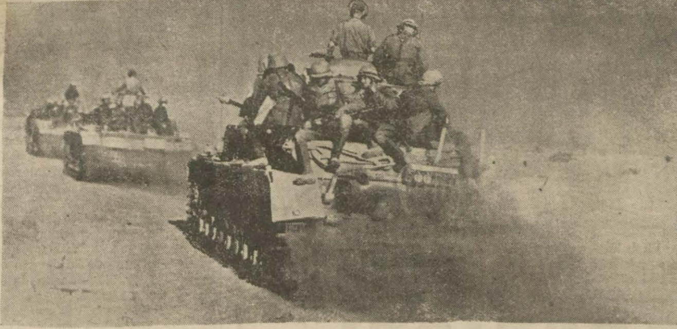
Alman tankları Libya çölünde hareket halinde